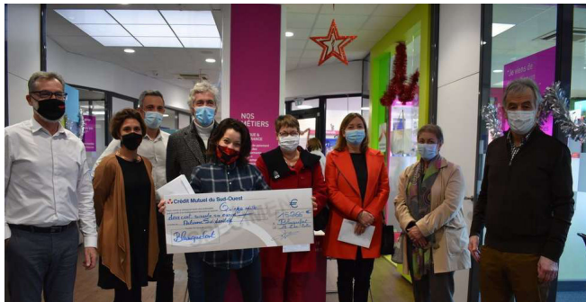
Don de 2 000 € à l'Hôpital de Jour de Caychac par le Crédit Mutuel du Sud-Ouest

Bibliothèque Mériadeck, 1 er étage. Dans le cadre de la Fabrique du citoyen.