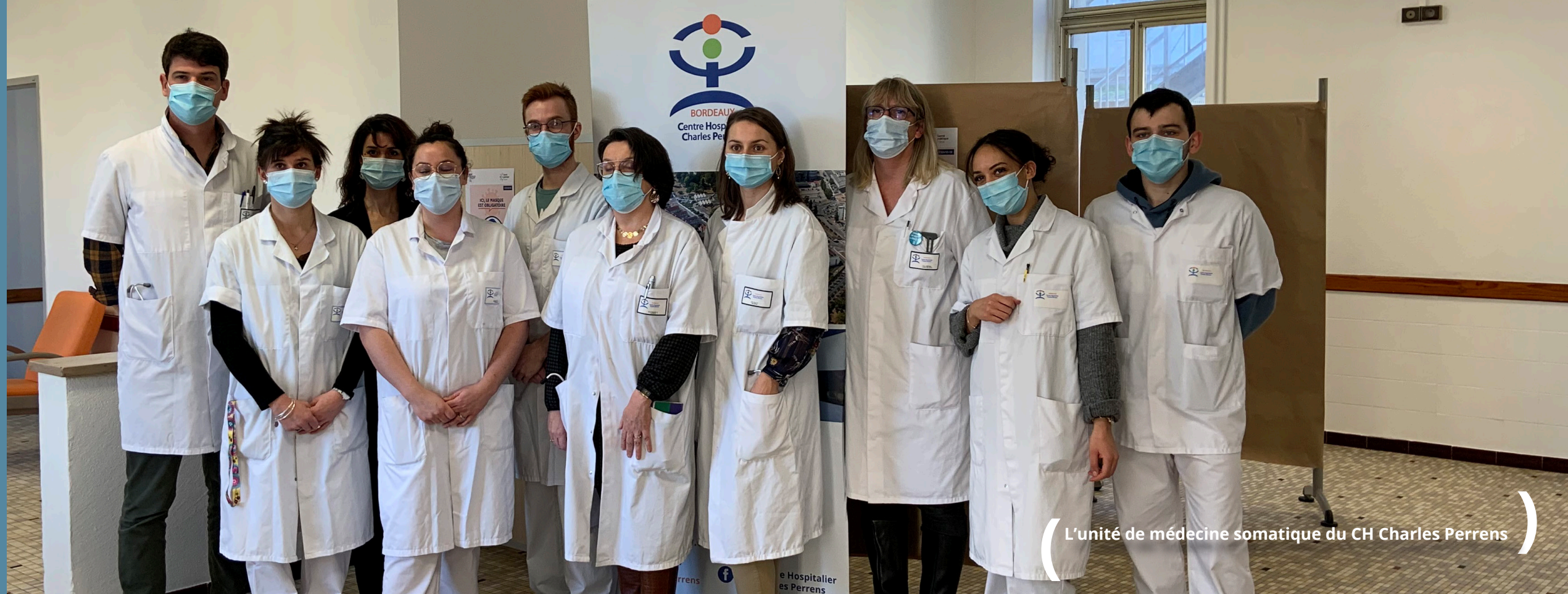
L'unité de médecine somatique du CH Charles Perrens