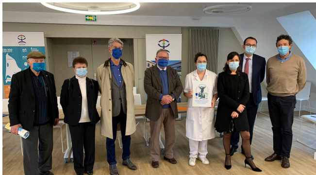
Remerciement de l'ensemble des professionnels par le Comité départemental de l'Ordre National du Mérite.