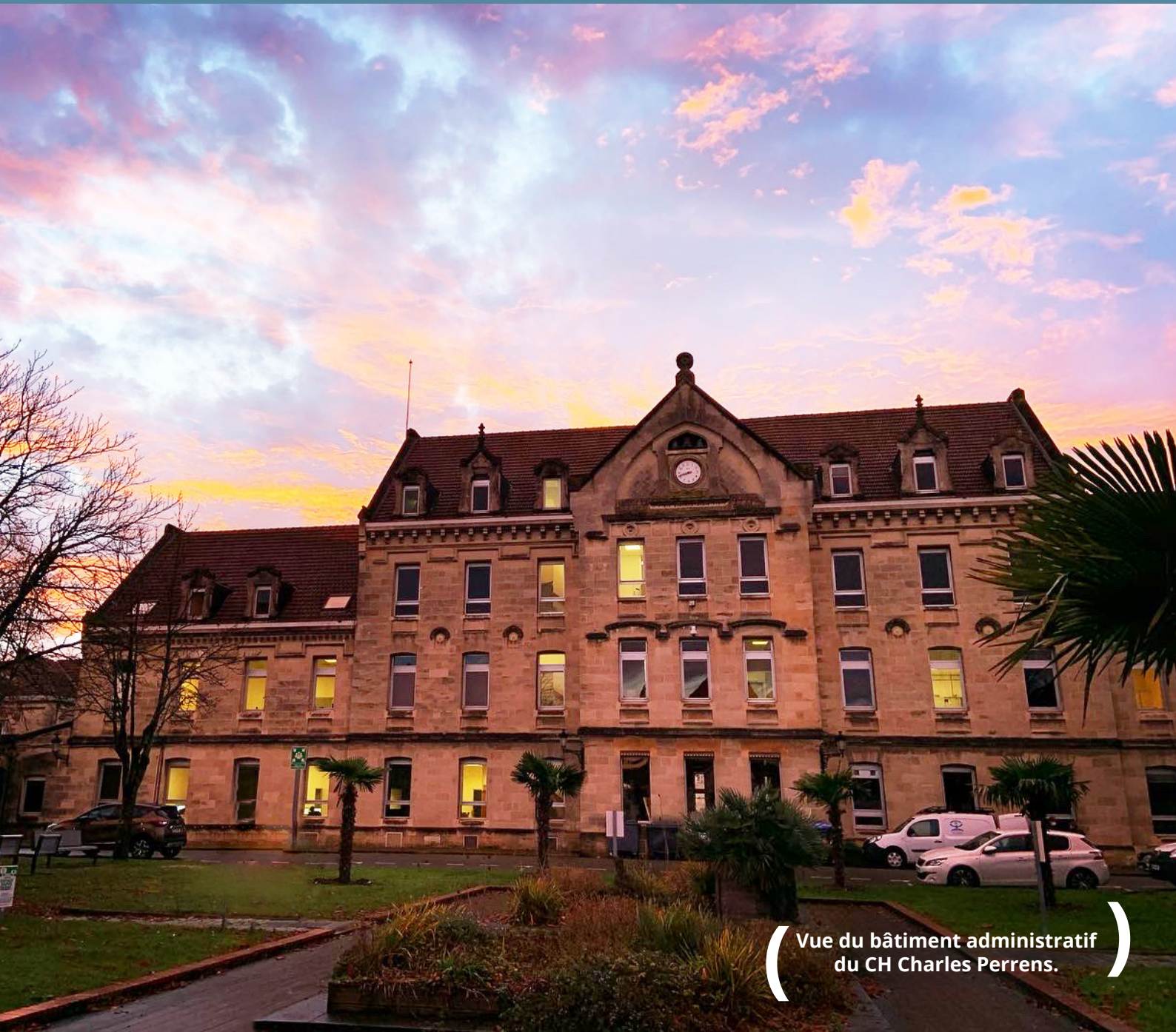
( Vue du bâtiment administratif du CH Charles Perrens. )