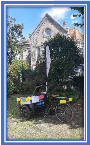
Wafae, usagère régulière de la MDU